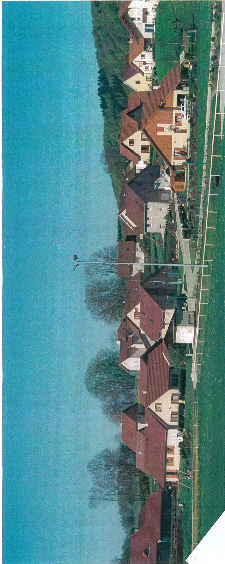
Lotissement du Levant : 1995 - 2001