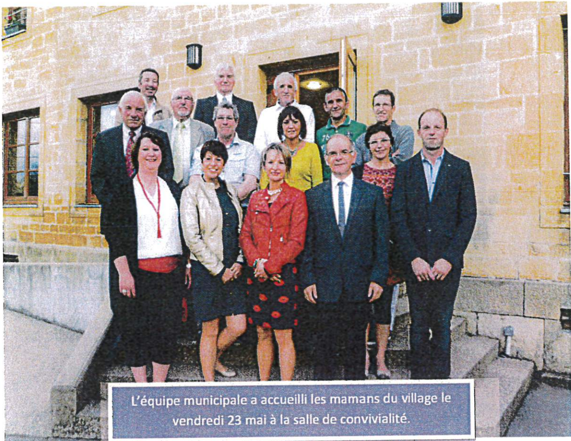
L'équipe municipale a accueilli les mamans du village le vendredi 23 mai à la salle de convivialité.