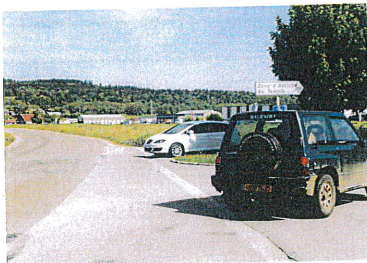
Croisement de la ZA au temple (un véhicule peut en cacher un autre)

En règle générale, soyons prudent sur cette portion de route maintenant très fréquentée par les camions.