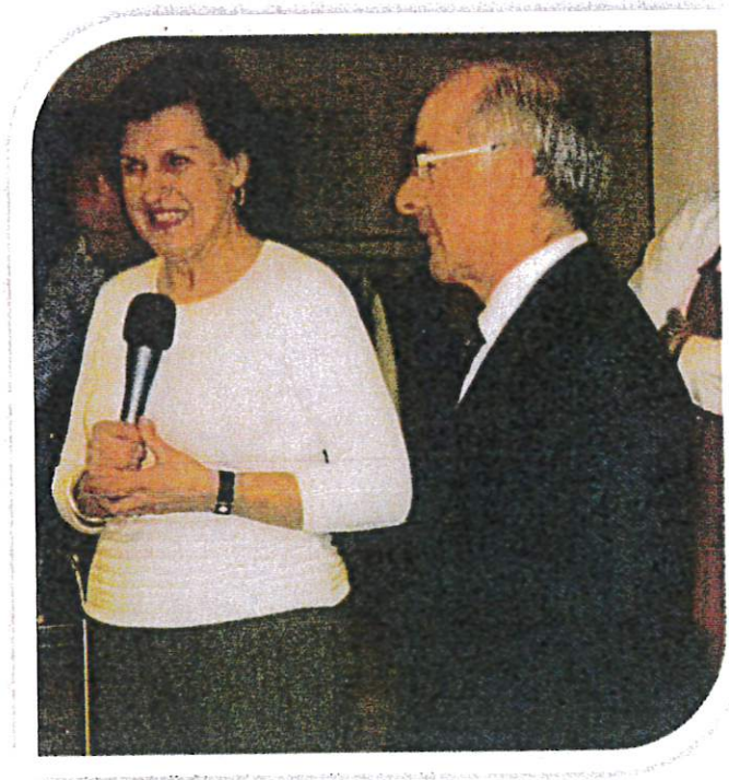
Madame Annie Genevard, Députée du Doubs nous a honorés de sa présence.